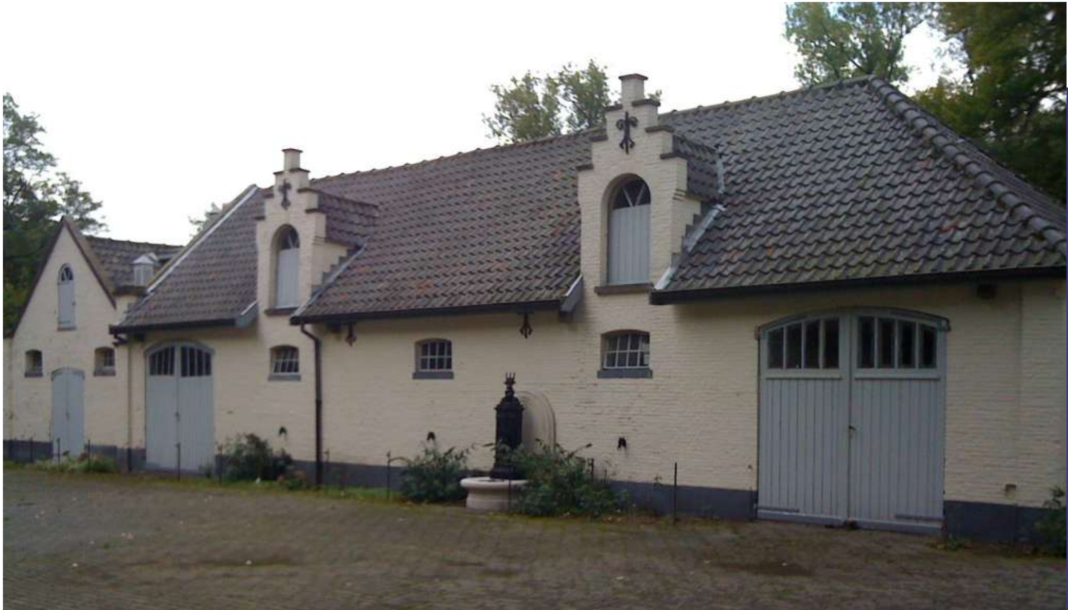
Boterberg | Kalmhout