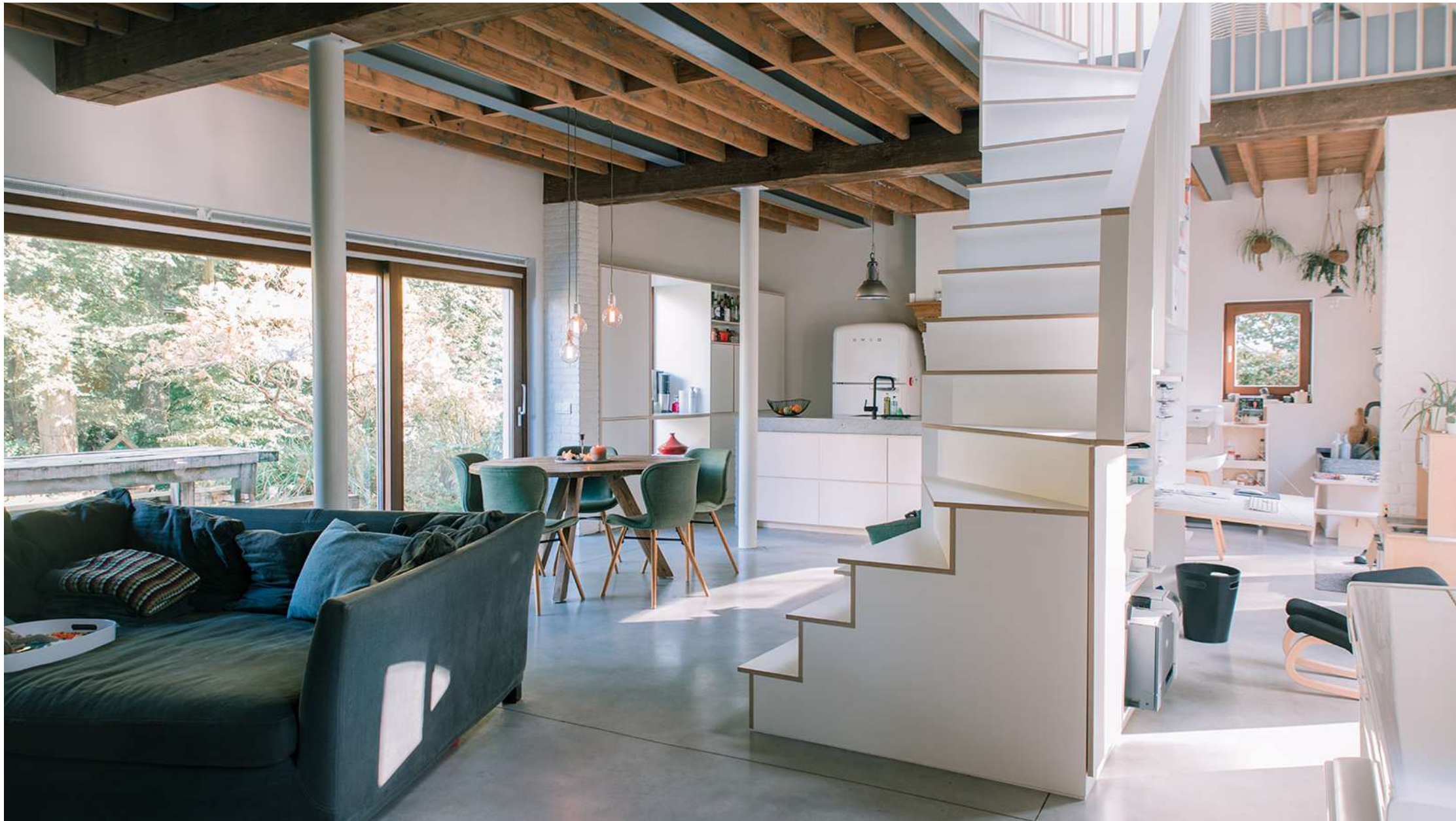
Boterberg | Kalmthout: 7 éénsgezinswoningen, zwembijver, moestuin, deelwagen | Winnaar Onroerendergoedprijs 2017