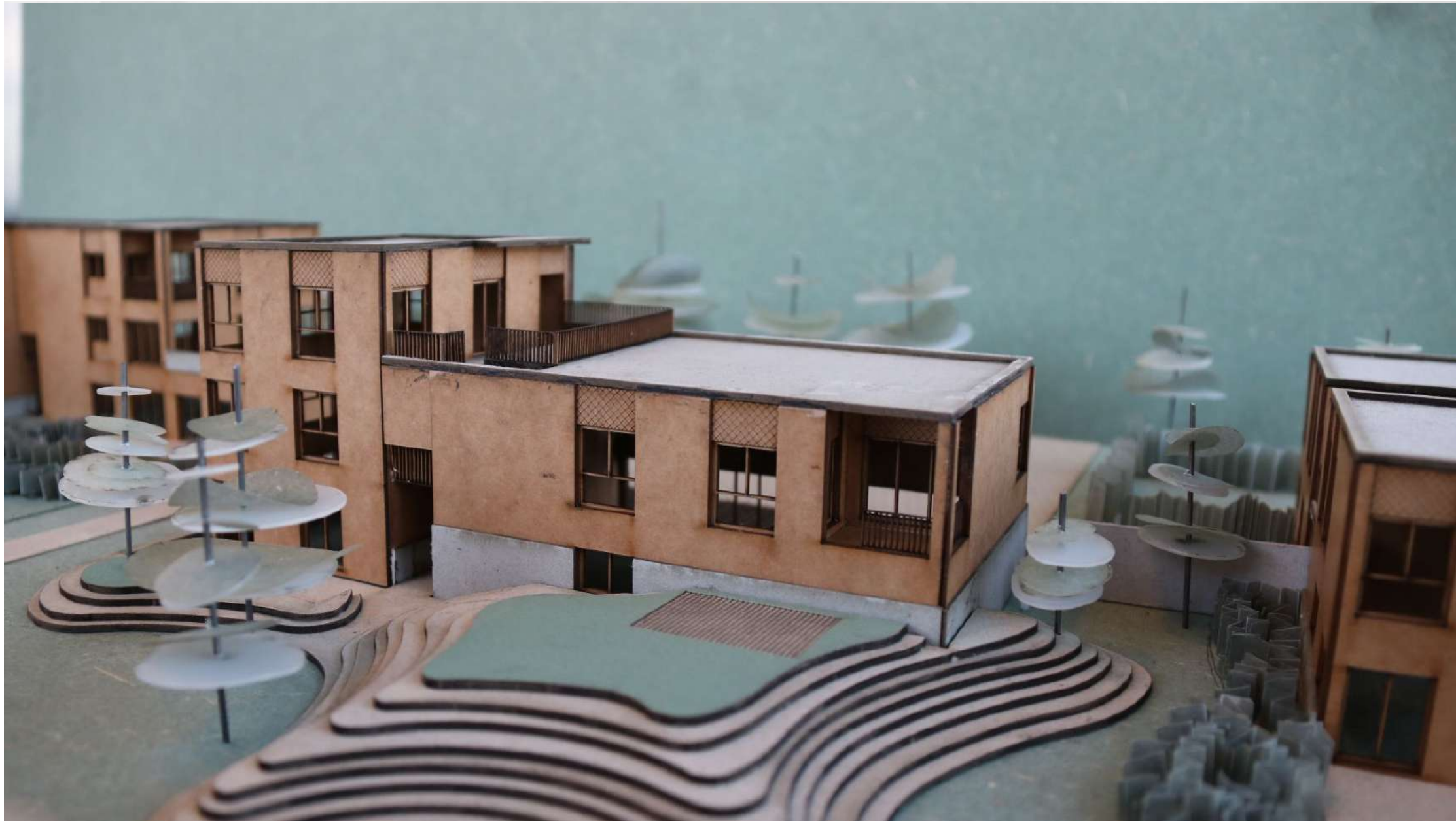
Seir | Wetteren Ten Ede: 48 woningen en appartementen, 5 inclusiestudio's, 2 handelsruimtes, binnen- en buitenzwembad, tuin met boomgaard, parkeergarage,...