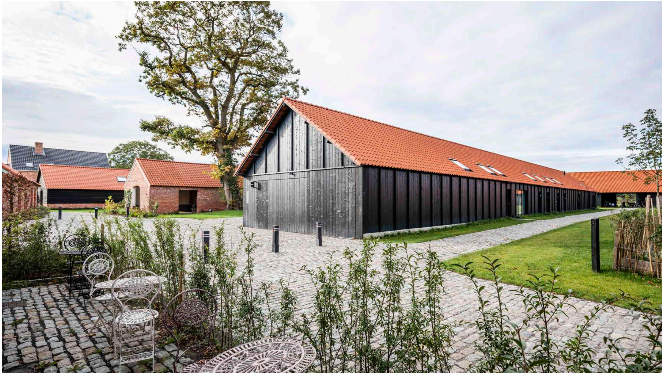
Qville | Essen: 43 woningen, zwembijver, binnenzwembad, buurthuis, elektrische deelwagens en gedeelde, aangelegde tuin. / Winnaar Res Awards 2021