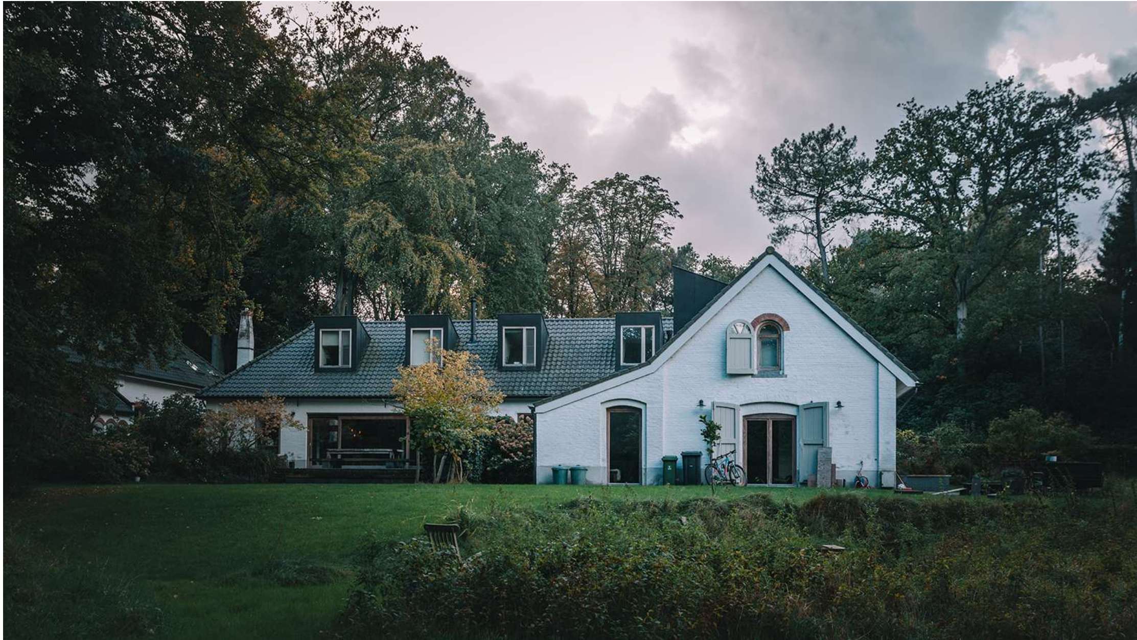
Boterberg | Kalmthout: 7 éénsgezinswoningen, zwembijver, moestuin, deelwagen | Winnaar Onroerendergoedprijs 2017