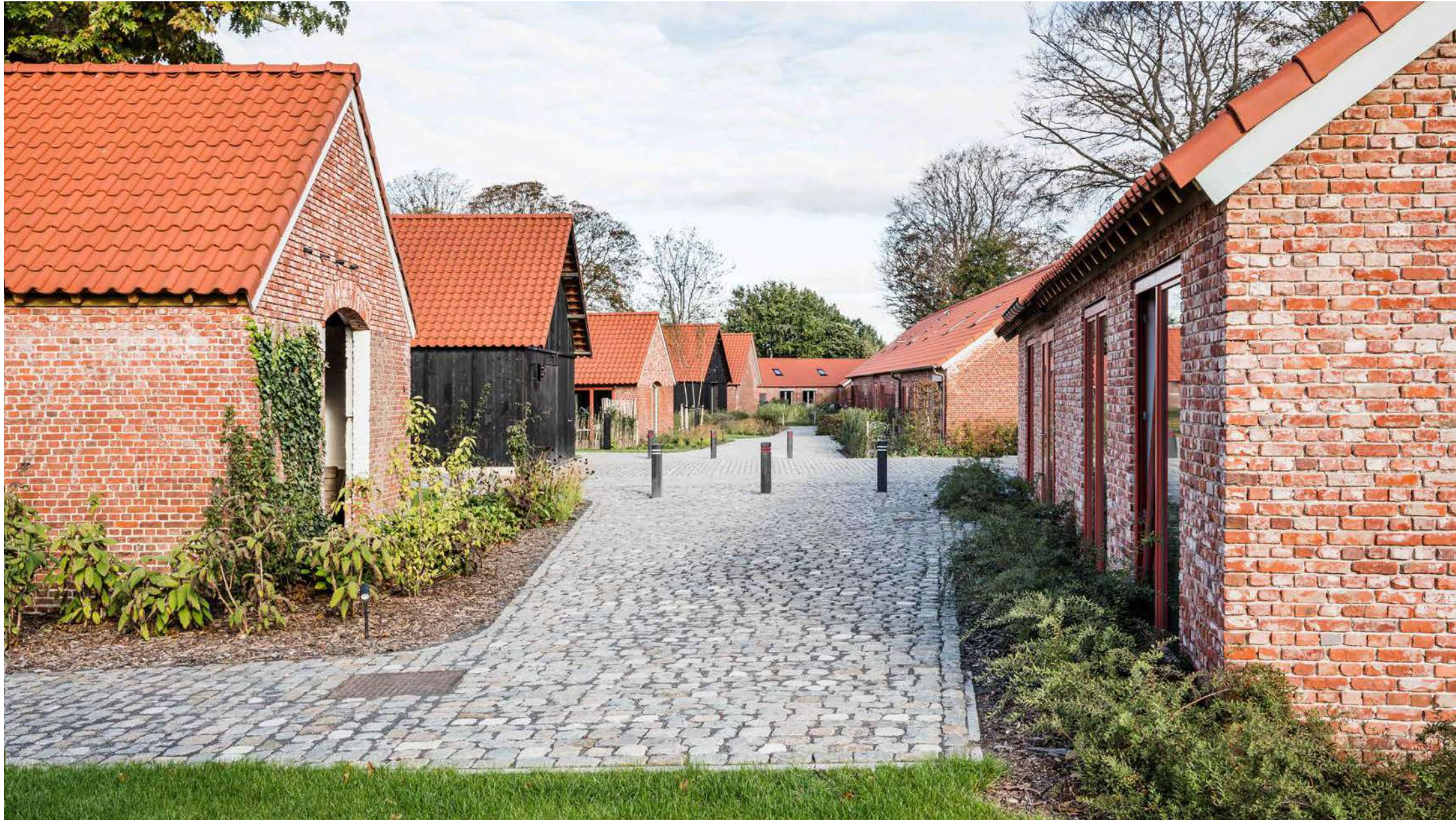
Qville | Essen: 43 woningen, zwembijver, binnenzwembad, buurthuis, elektrische deelwagens en gedeelde, aangelegde tuin. / Winnaar Res Awards 2021