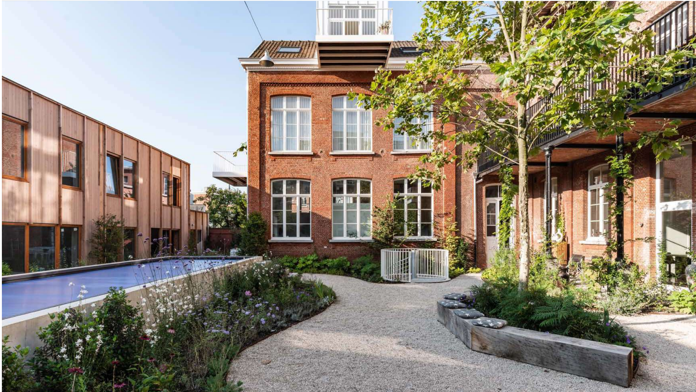
Academie | Turnhout: 15 BEN-woningen, 1 kantoorruimte, aangelegde binnenplaats met buitenzwembad, buurthuis, sauna en deelwagen.