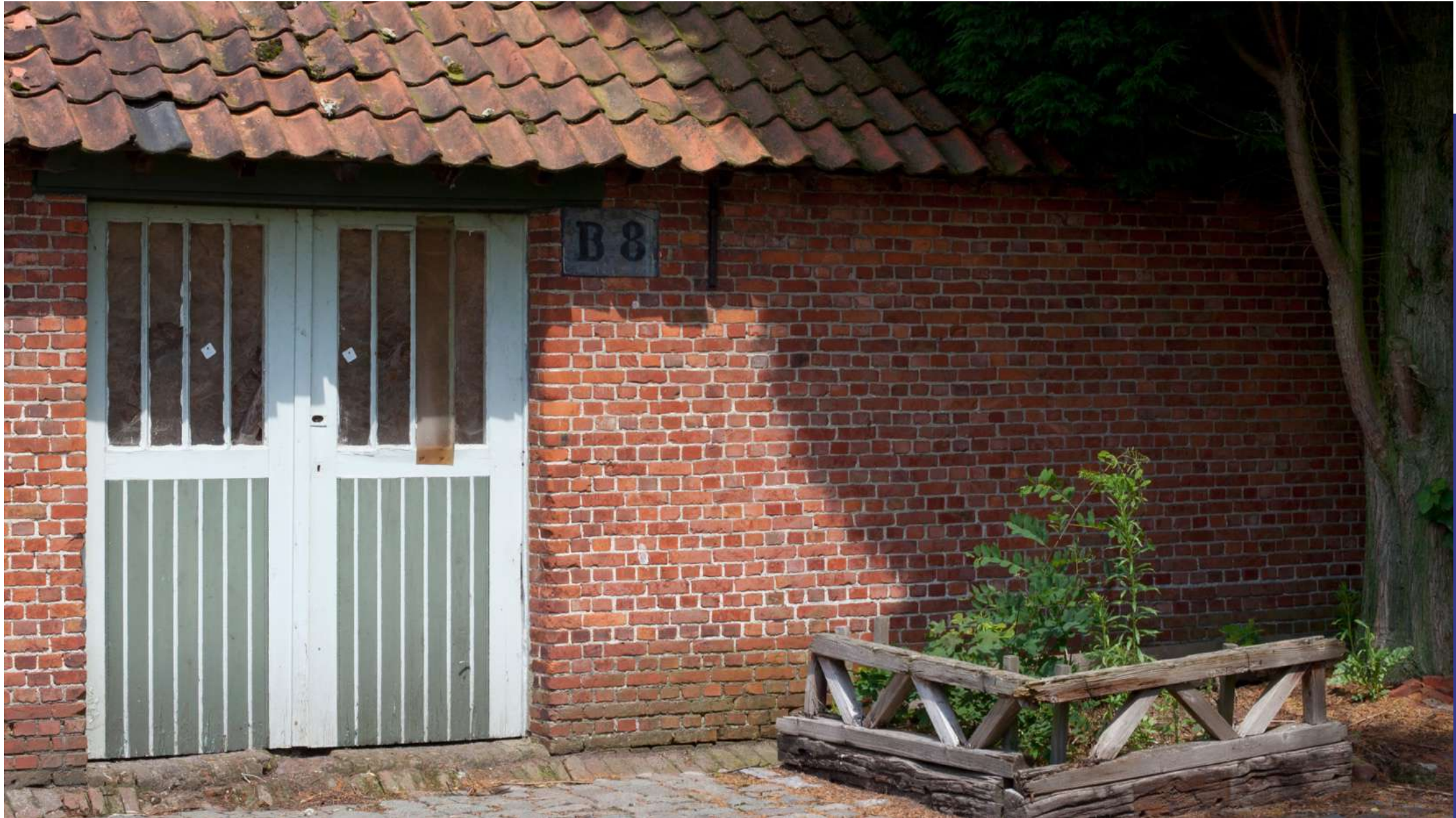
Qville | Essen