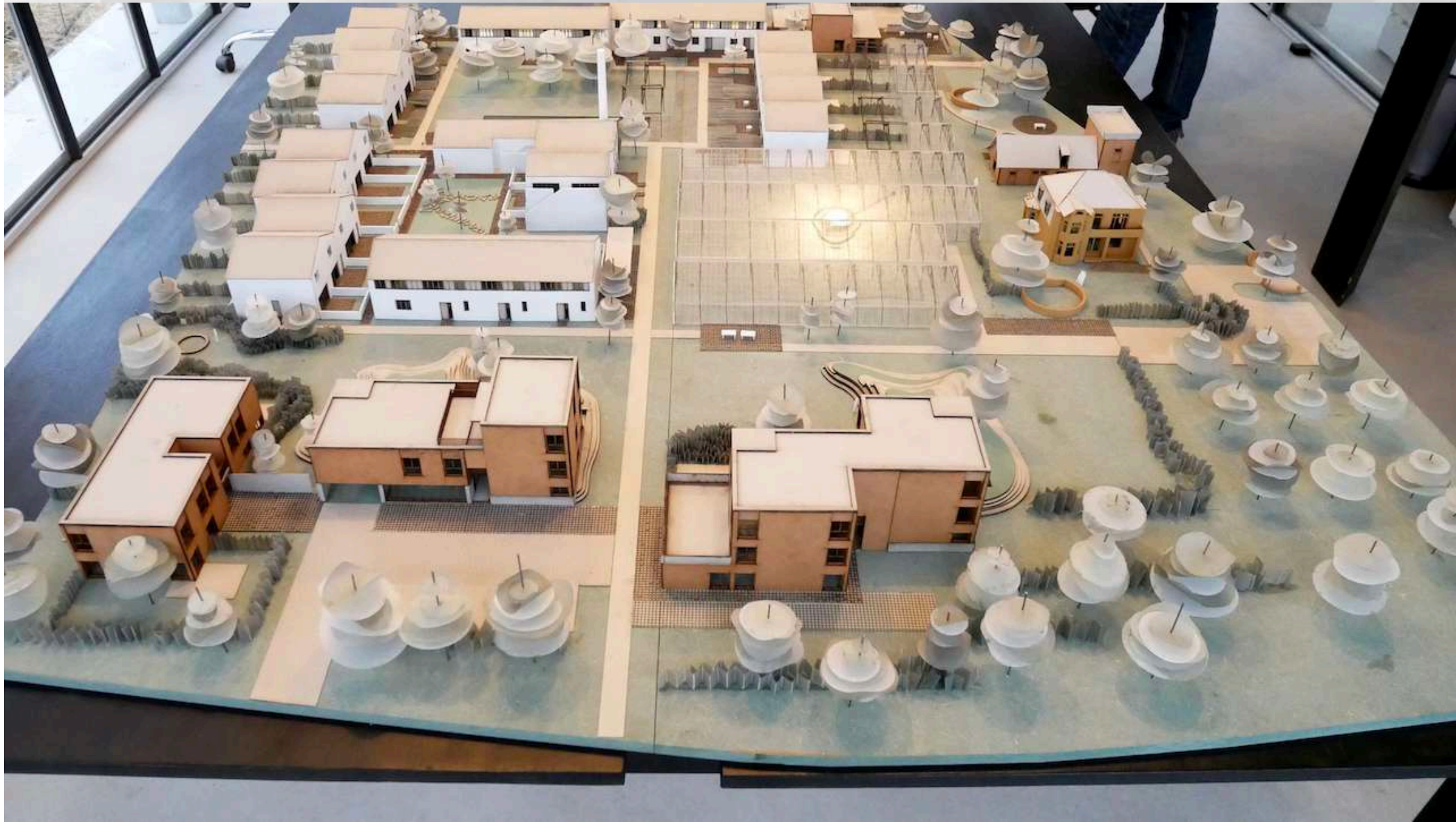
Seir | Wetteren Ten Ede: 48 woningen en appartementen, 5 inclusiestudio's, 2 handelsruimtes, binnen- en buitenzwembad, tuin met boomgaard, parkeergarage,...