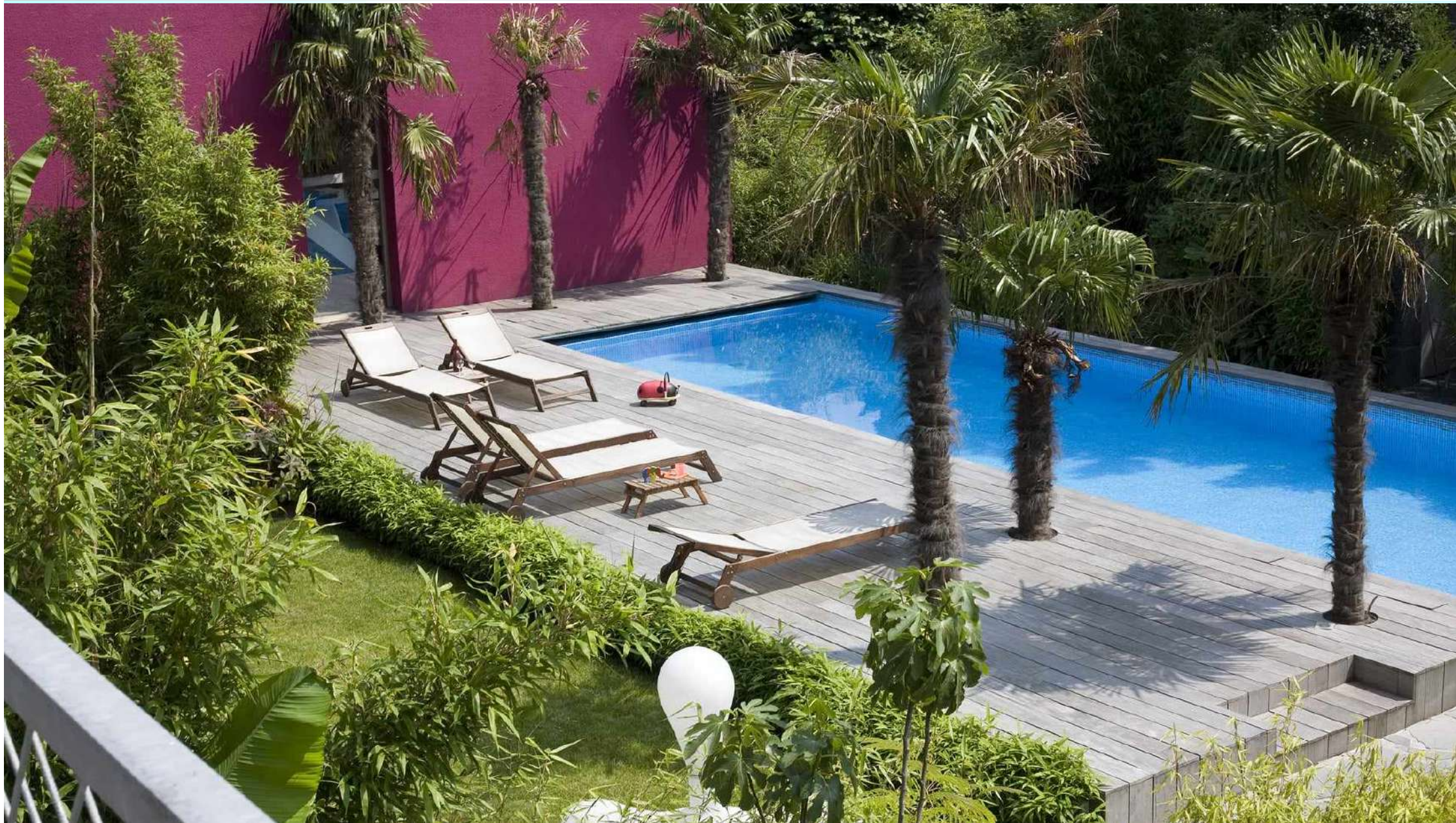
D-Factory | Deurne: 11 lofts, 11 appartementen, verwarmd buitenzwembad, aangelegde tropische tuin, psychotherapiepraktijk en kunstgalerij.