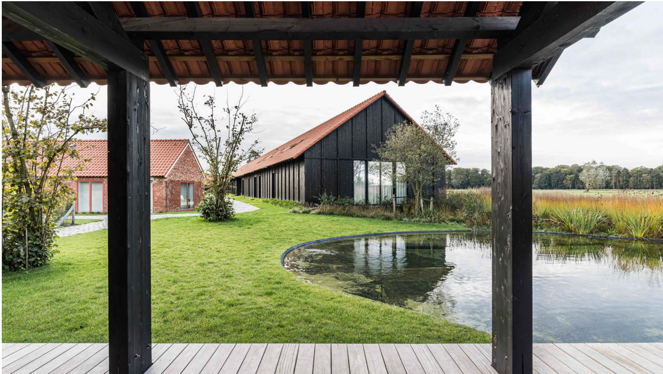
Qville | Essen: 43 woningen, zwembijver, binnenzwembad, buurthuis, elektrische deelwagens en gedeelde, aangelegde tuin. / Winnaar Res Awards 2021