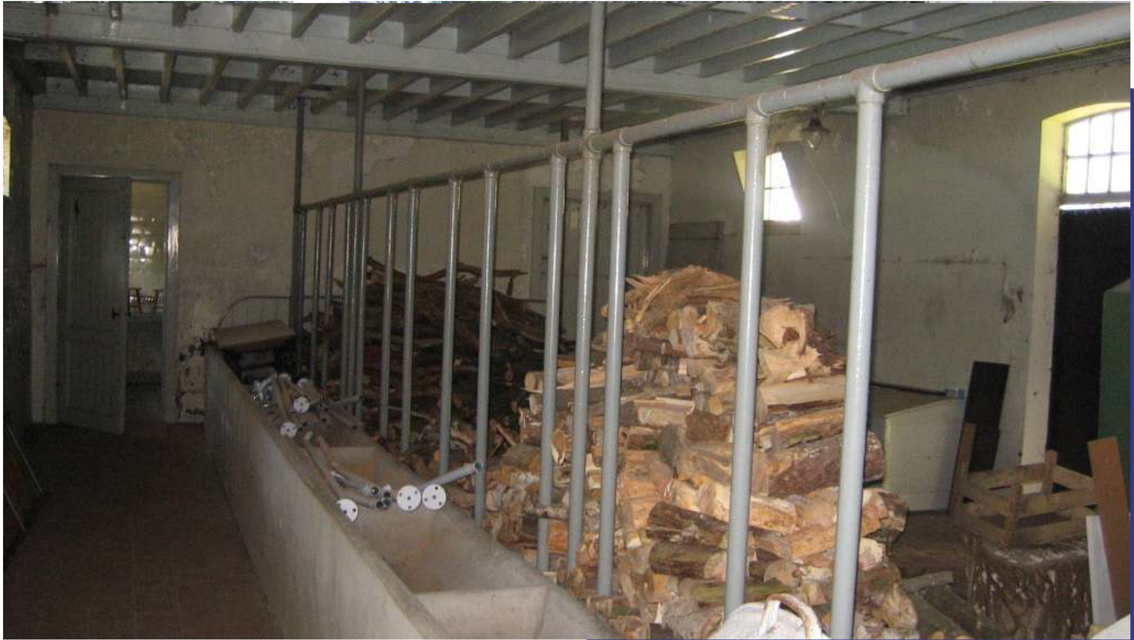
Boterberg | Kalmhout