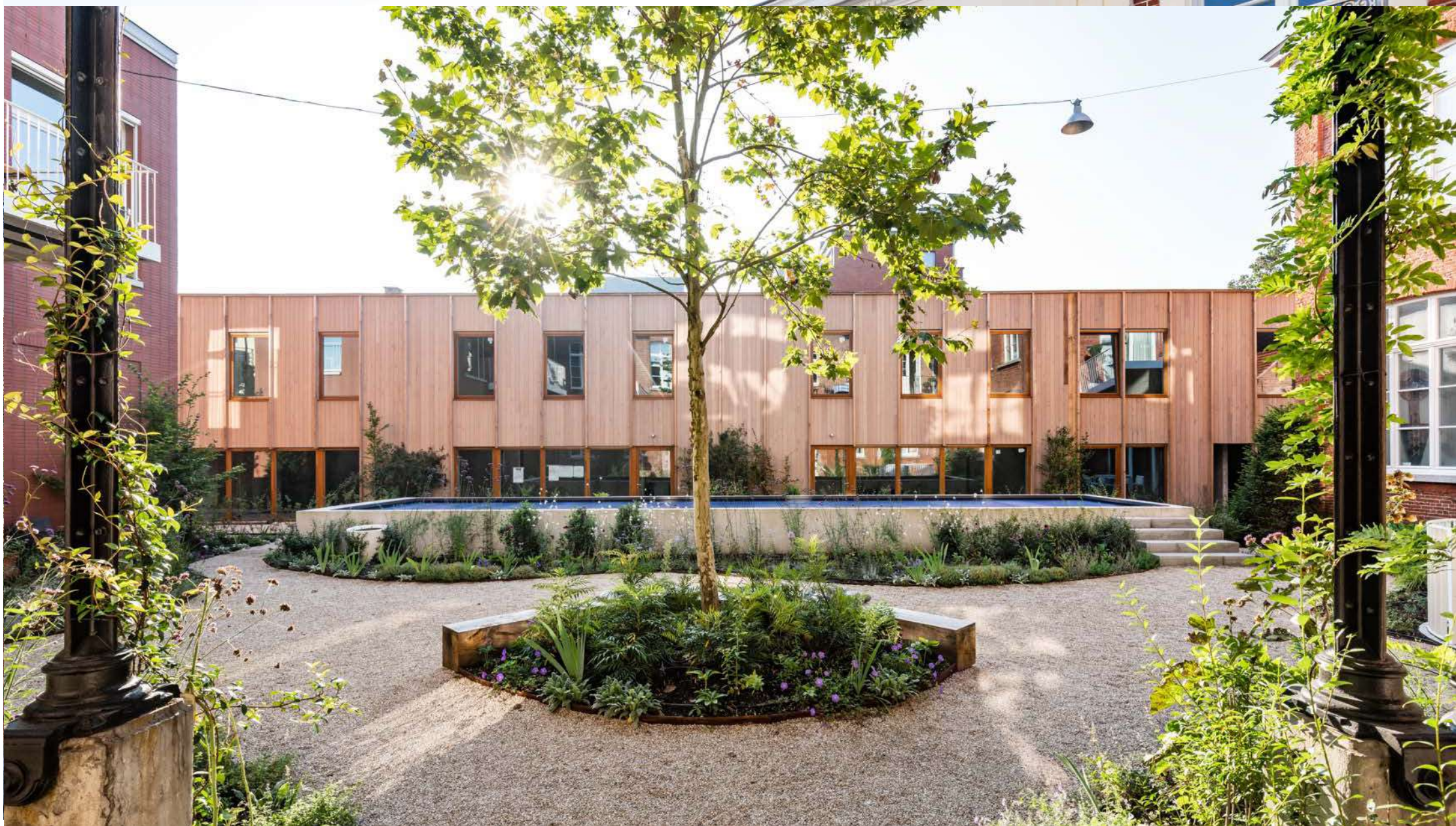
Academie | Turnhout: 15 BEN-woningen, 1 kantoorruimte, aangelegde binnenplaats met buitenzwembad, buurthuis, sauna en deelwag.