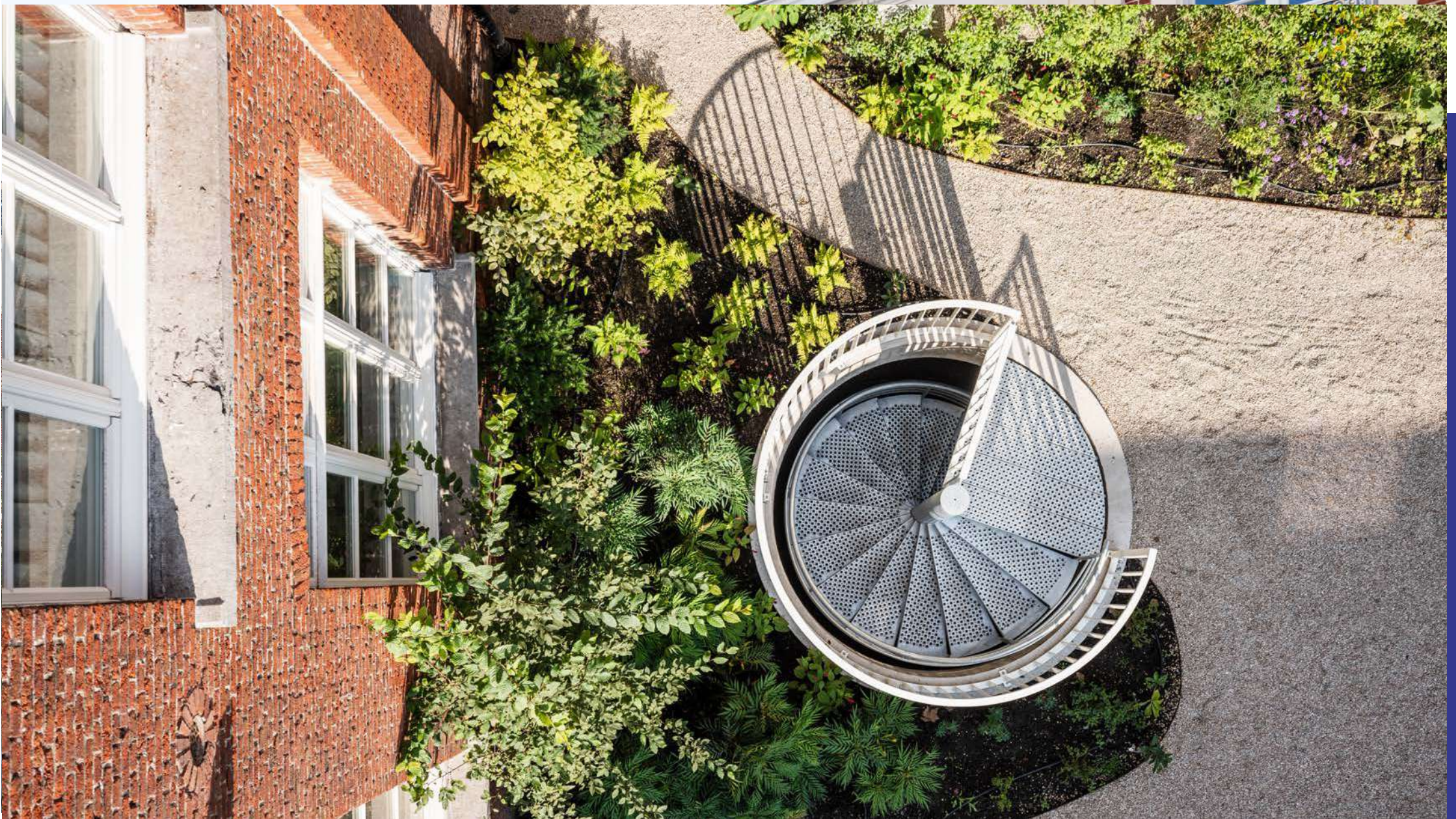
Academie | Turnhout: 15 BEN-woningen, 1 kantoorruimte, aangelegde binnenplaats met buitenzwembad, buurthuis, sauna en deelwagen.