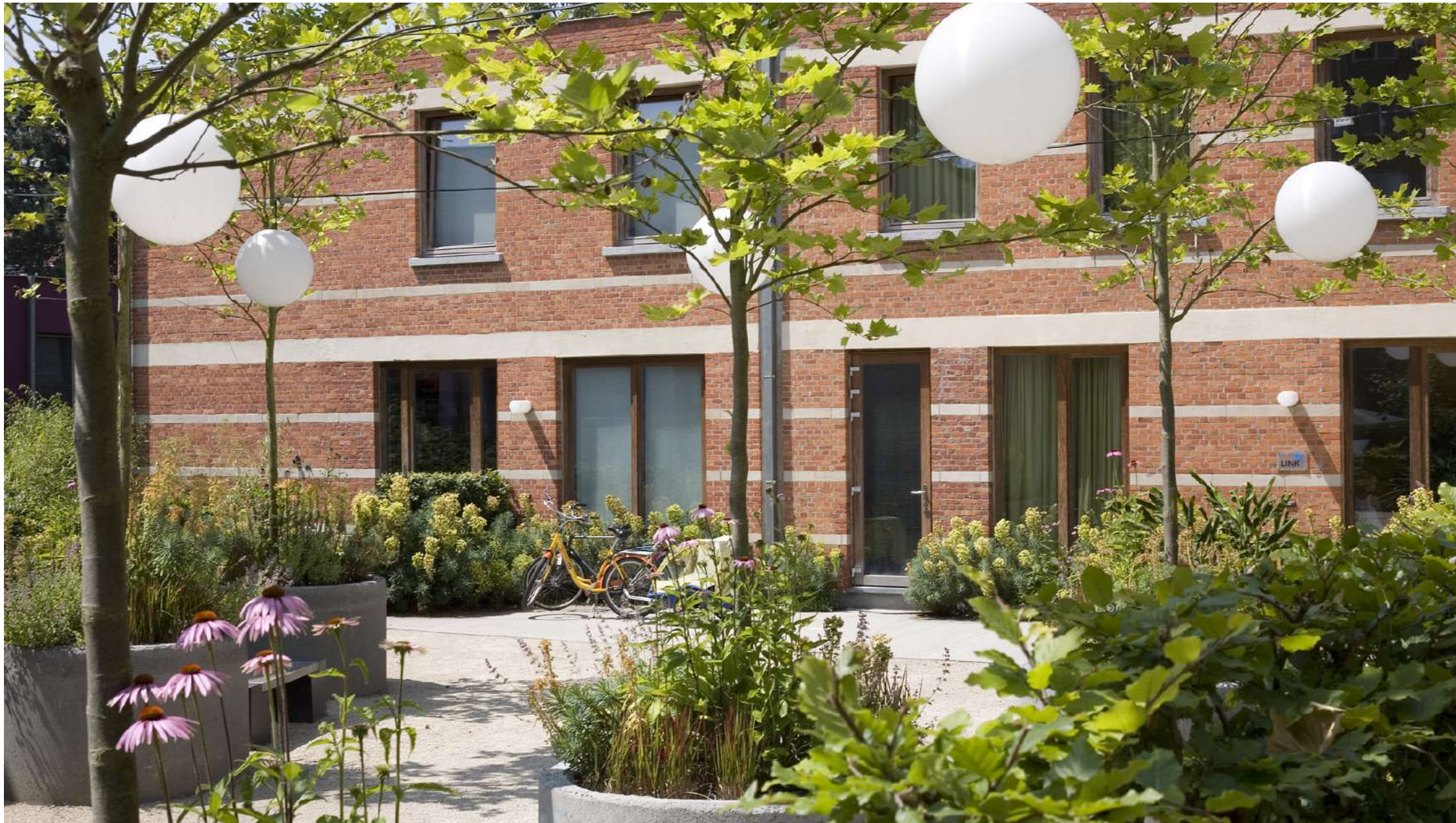
D-Factory | Deurne: 11 lofts, 11 appartementen, verwarmd buitenzwembad, aangelegde tropische tuin, psychotherapiepraktijk en kunstgalerij.