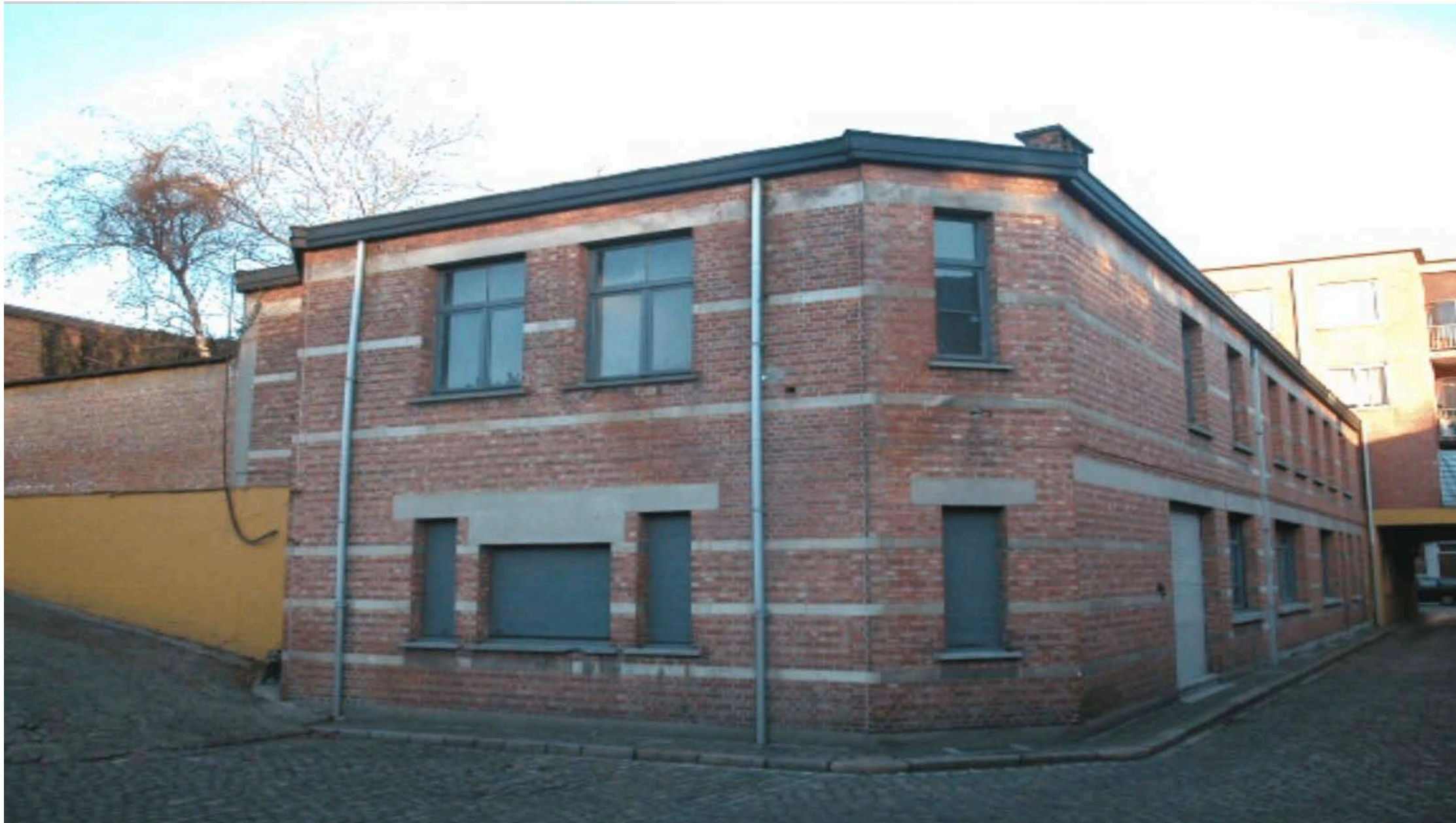
D-Factory | Deurne