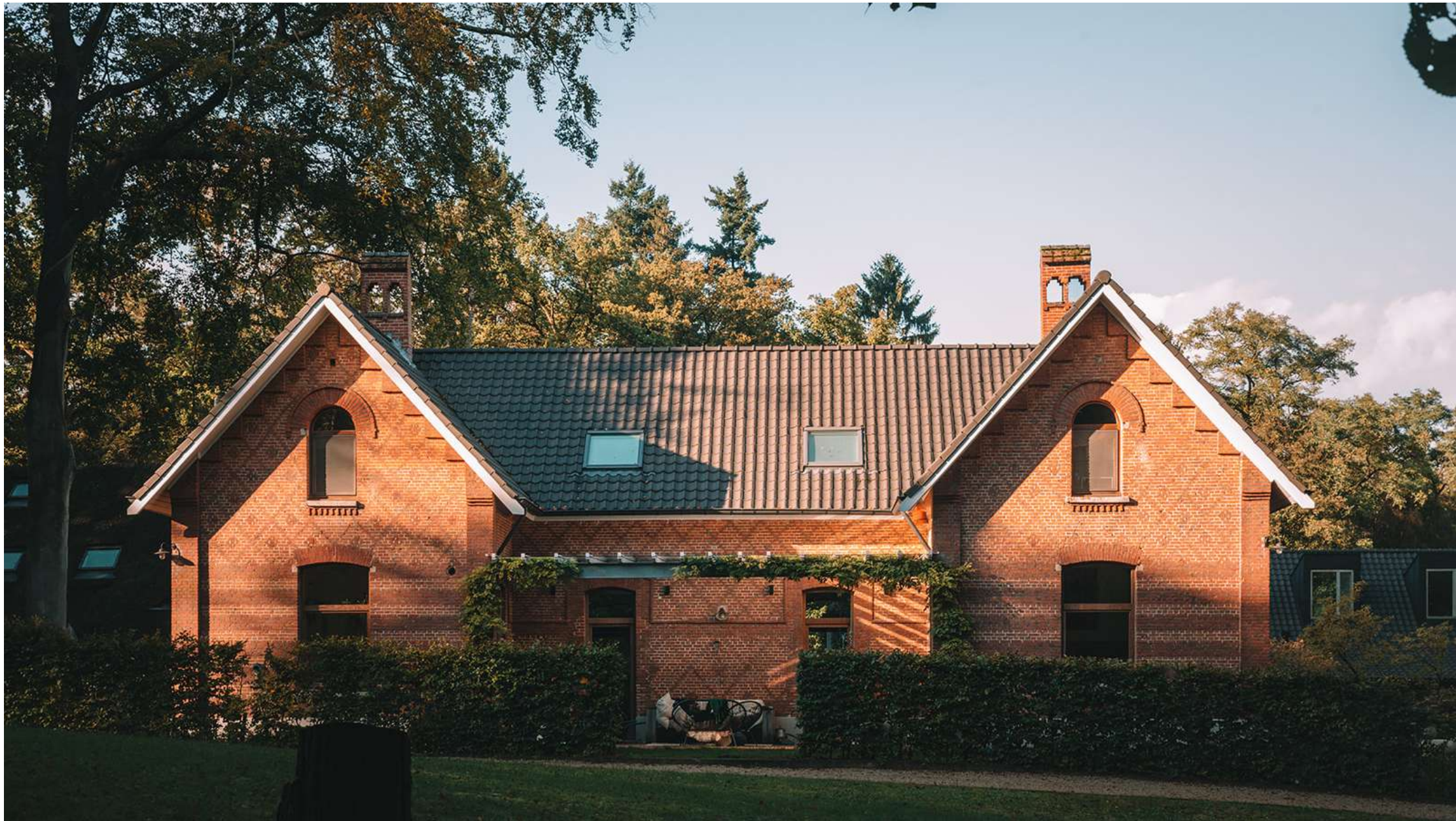
Boterberg | Kalmthout: 7 éénsgezinswoningen, zwembijver, moestuin, deelwagen | Winnaar Onroerendergoedprijs 2017