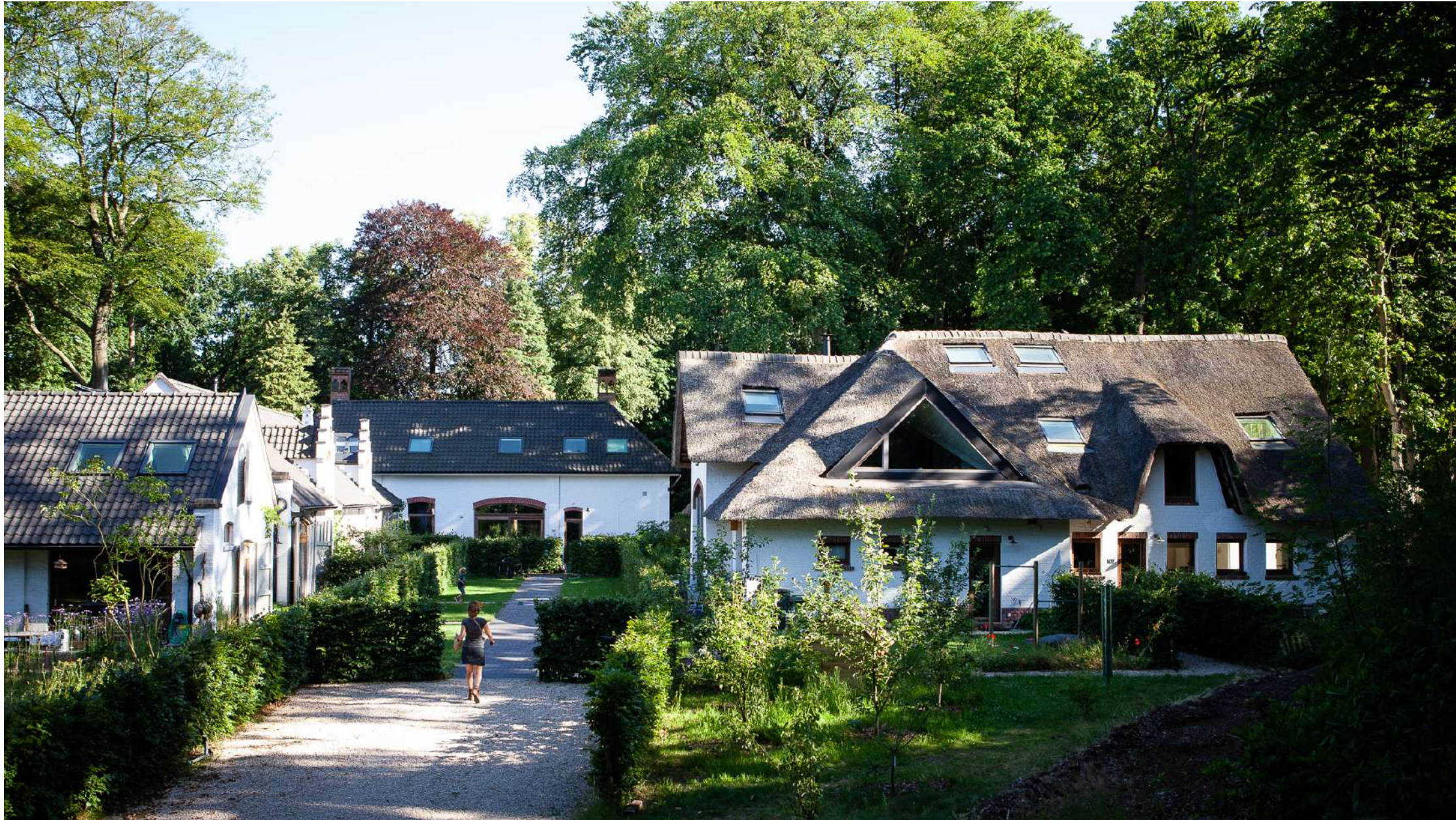
Boterberg | Kalmthout: 7 éénsgezinswoningen, zwembijver, moestuin, deelwagen | Winnaar Onroerendergoedprijs 2017