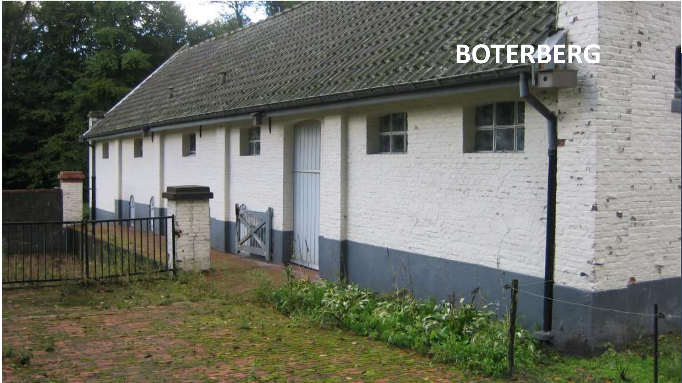
Boterberg | Kalmhout