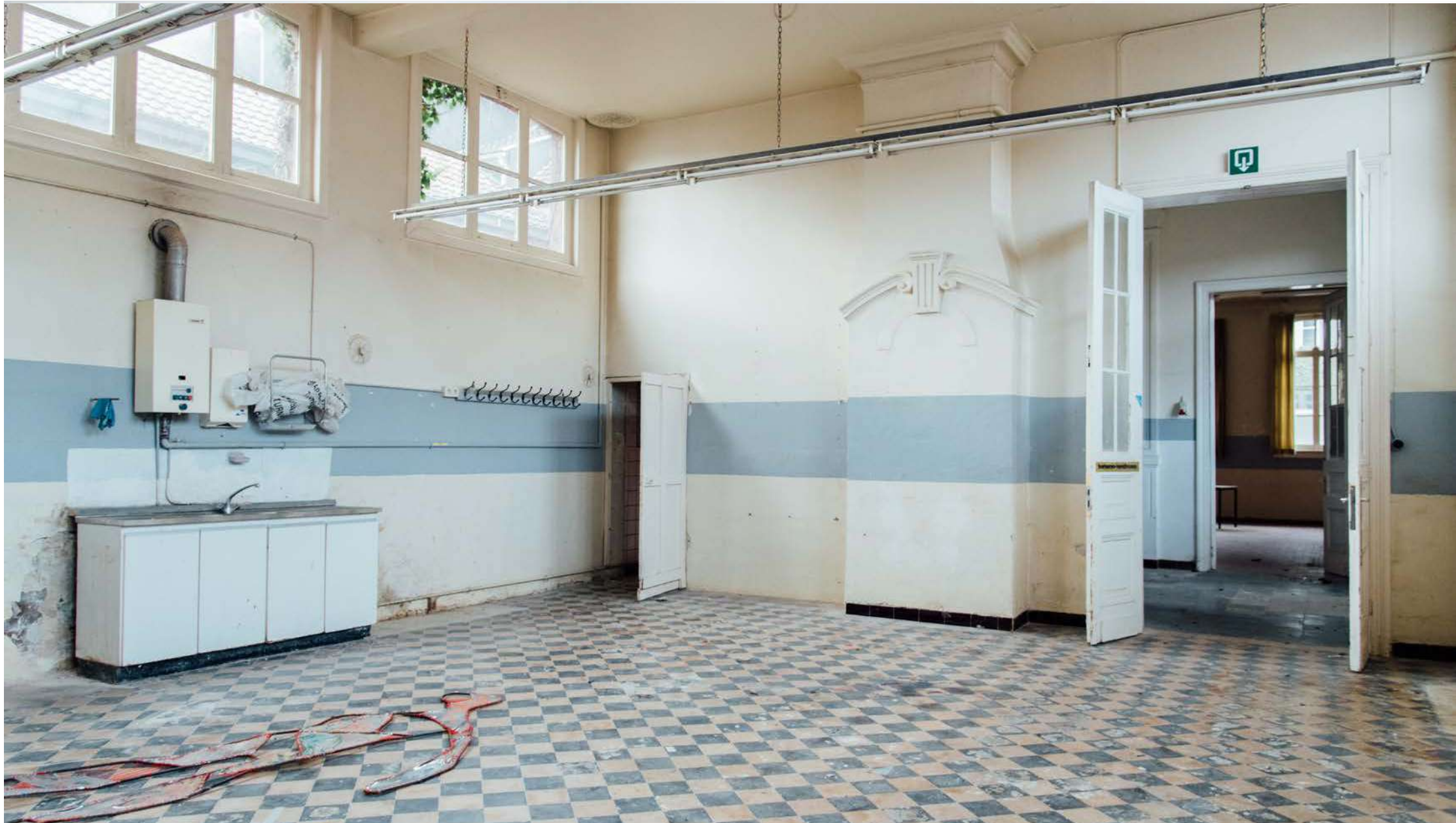
Academie | Turnhout