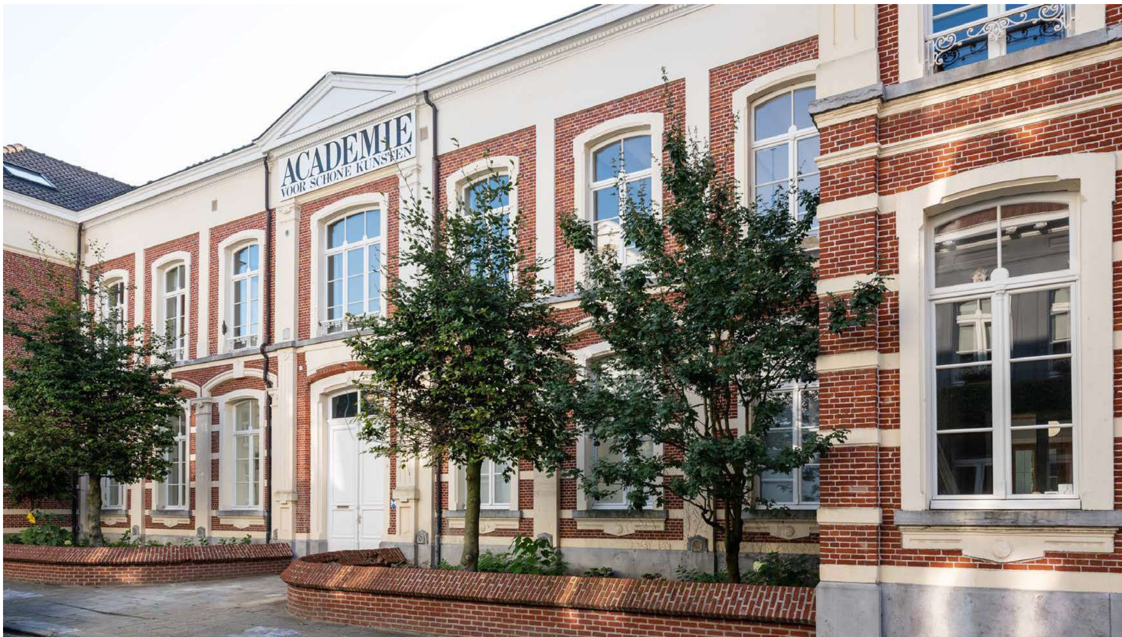
Academie | Turnhout: 15 BEN-woningen, 1 kantoorruimte, aangelegde binnenplaats met buitenzwembad, buurthuis, sauna en deelwagen.