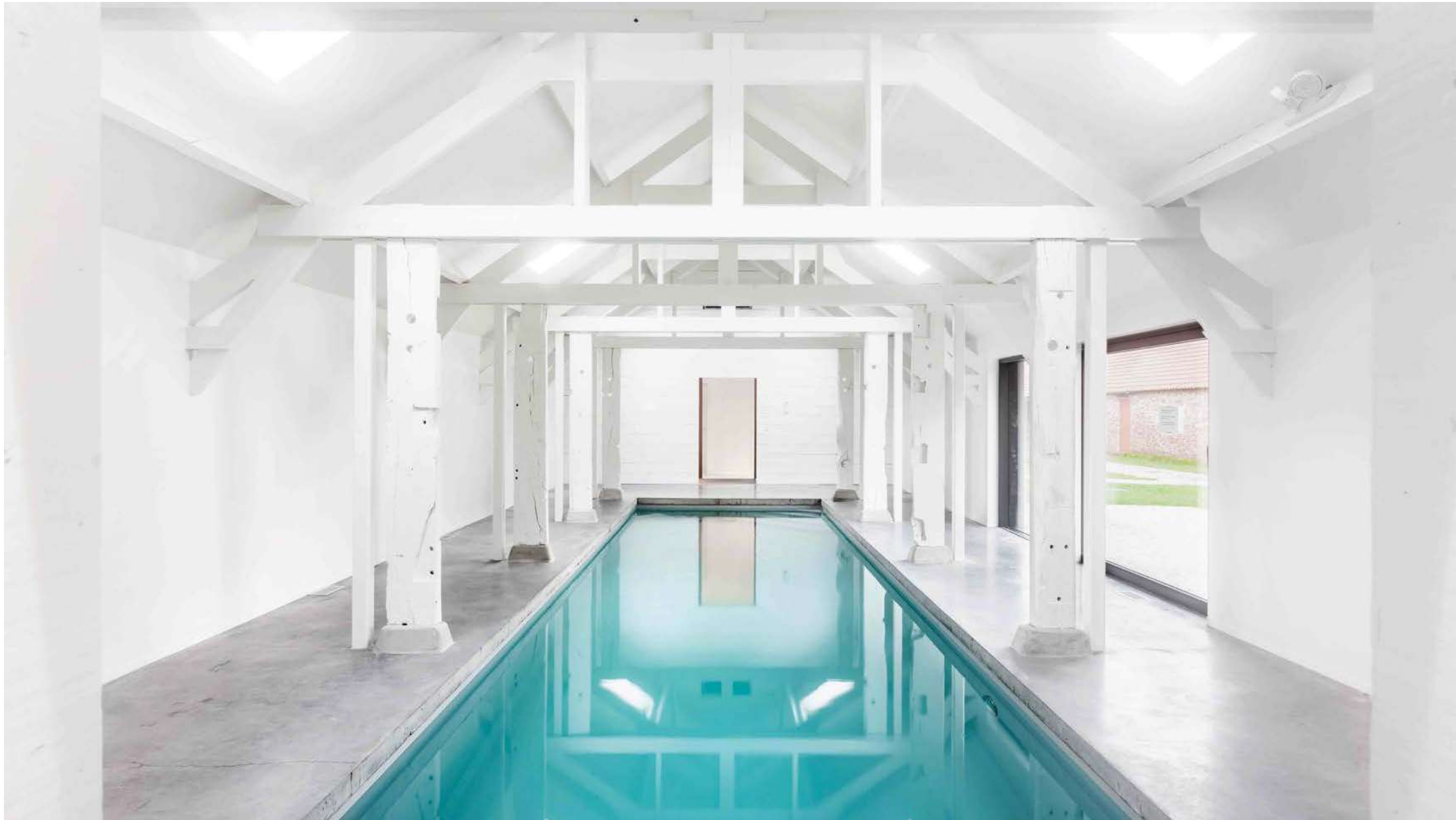
Qville | Essen: 43 woningen, zwembijver, binnenzwembad, buurthuis, elektrische deelwagens en gedeelde, aangelegde tuin. / Winnaar Res Awards 2021