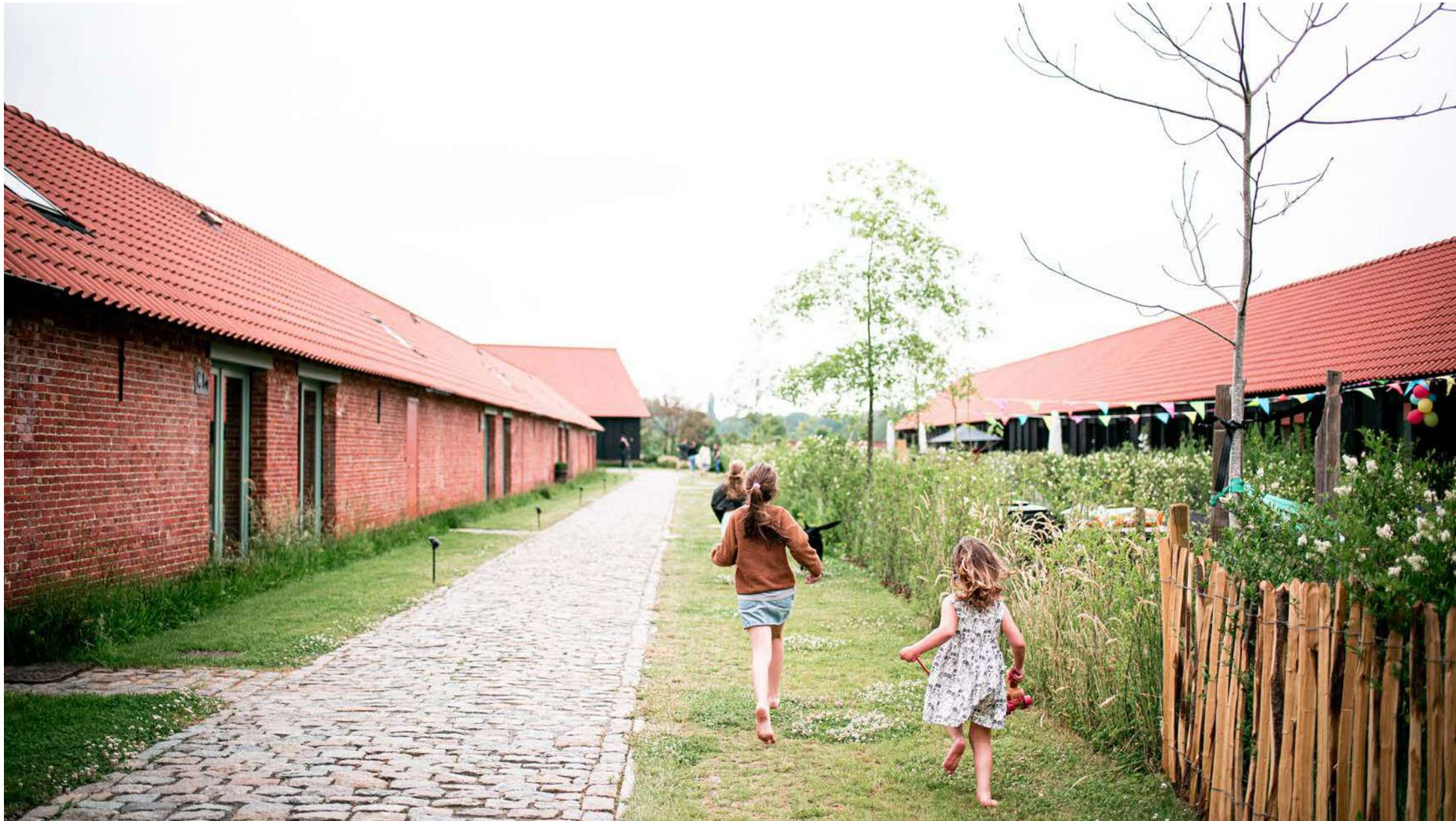
Qville | Essen: 43 woningen, zwembijver, binnenzwembad, buurthuis, elektrische deelwagens en gedeelde, aangelegde tuin. / Winnaar Res Awards 2021