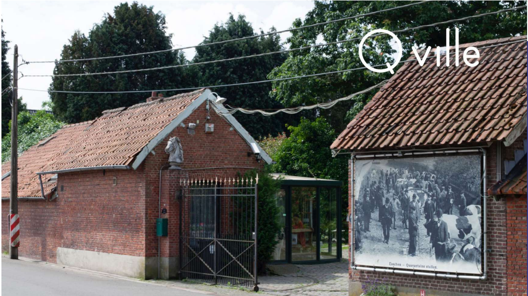
Qville | Essen