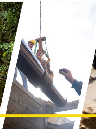
bestaande en nieuwe riolering