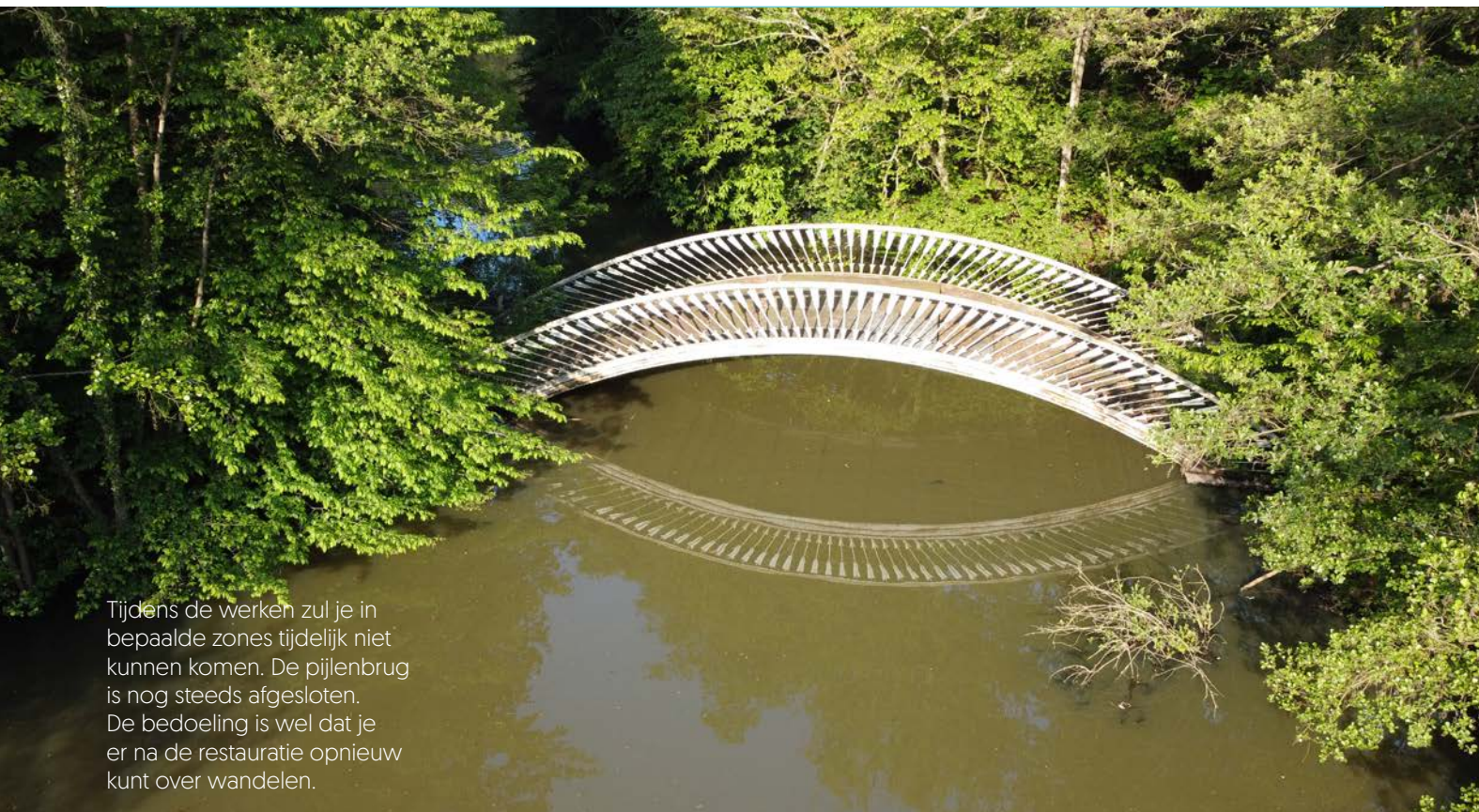
Tijdens de werken zul je in bepaalde zones tijdelijk niet kunnen komen. De pijlenbrug is nog steeds afgesloten. De bedoeling is wel dat je er na de restauratie opnieuw kunt over wandelen.